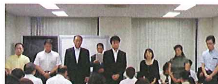
(退任理事の皆さん)